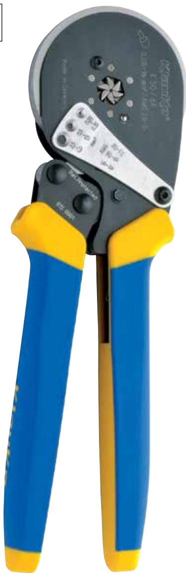
K30/6K Praska ręczna Mechanical crimping tool