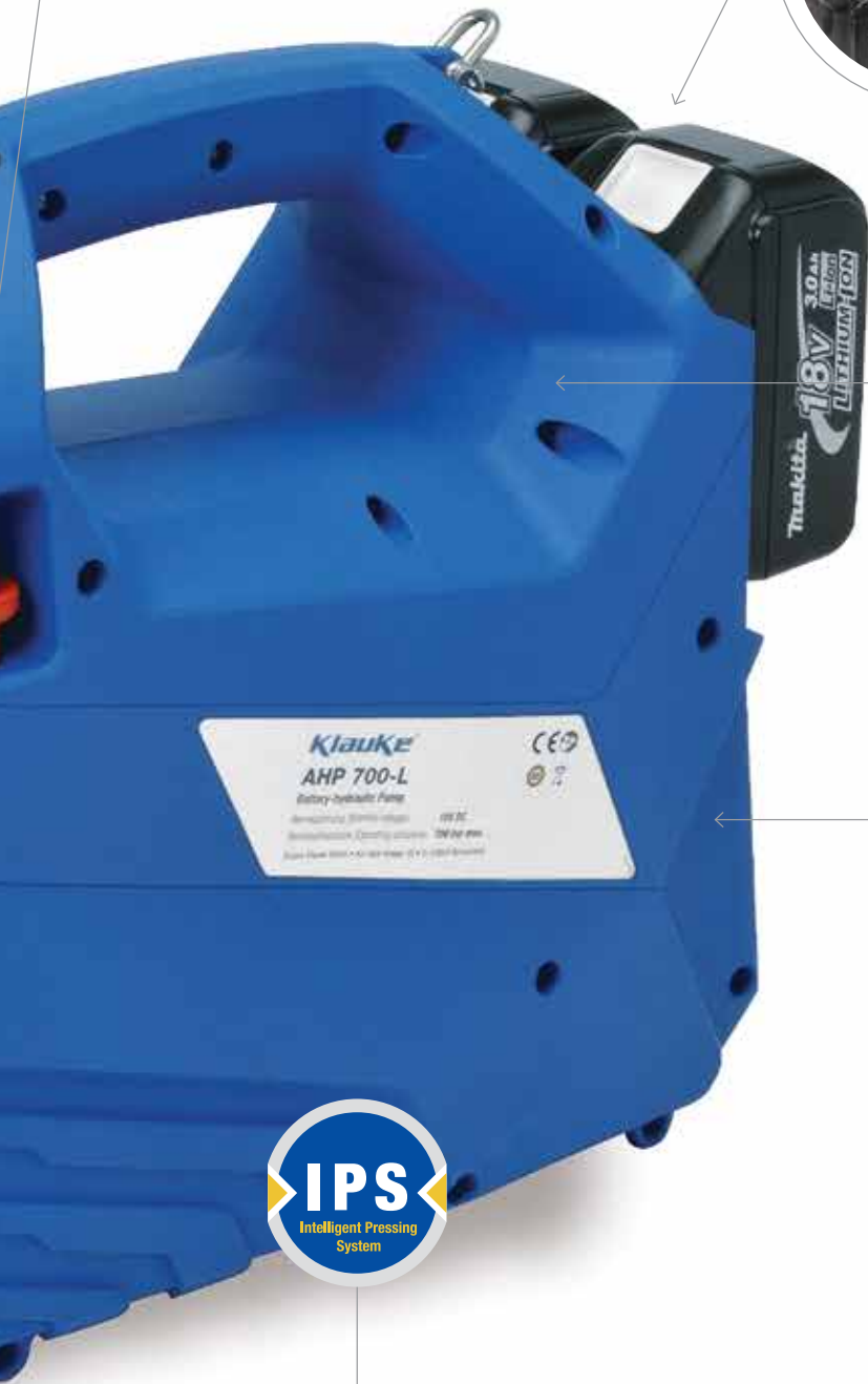
Obudowa z odpornego, wzmacnianego włóknom szklanym tworzywa sztucznego