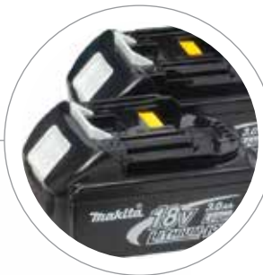
Dwa mocne akumulatory Li-Ion o dużej pojemności