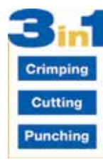
AHP700-L i głowica PK1000