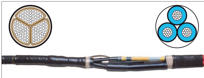
Kabel o izolacji papierowej ekranowanej lub rdzeniowej i kabel 3-żyłowy o izolacji z tworzywa sztucznego